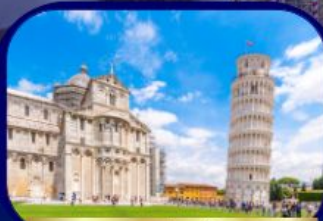
หอเอนแห่งเมืองปิซ่า