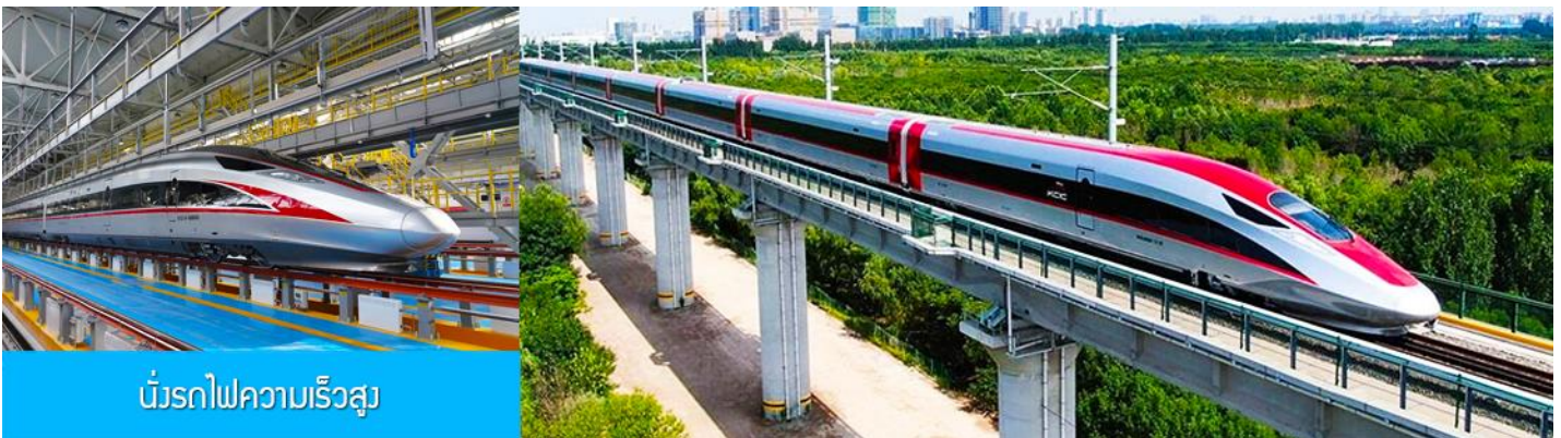
นักรถไฟความเร็วสูง