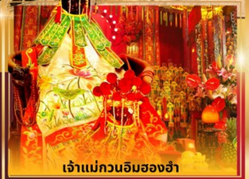
เจ้าแม่กวนอิมสองอ่า

ช้อปปิ้งบนคนเดินตงเหมิน เมืองโบราณหนานโกว วัดกวนอู ร้านหนังสือจงซูเก้อ ถ่ายรูปหน้าตึกฟิงอัน เจ้าแม่กวนอิมสองอ่า วัดหวังต้าเซียน วัดแชกงหมิว ช้อปปิ้งย่านจิมซาจู้ นองปิง 360 สักการะวัดพระใหญ่โป่หลิน ช้อปปิ้งซีตี้เกทเอาท์เล็ต