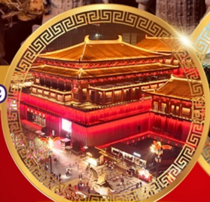
ย่านถนนคนเดินต้าถิง

วัดเล่าหลิน การแสดงโชว์กังฟู ป่าเจดีย์วัดเล่าหลิน ศาลเจ้ากวนอู ชมถ้ำผาหลงเหมิน จัตุรัสหอกลอง จัตุรัสหอรบั้ง ตลาดมุสลิม สุสานจีนซีอองเต้ กำแพงเมืองซีอาน ชมเจดีย์ห่านป่าใหญ่ ย่านถนนคนเดินต้าถิง