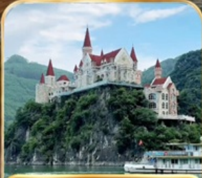
ล่องทะเลสาบวั้นเฟิงหู