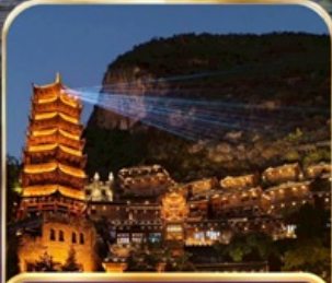
หมู่บ้านโบราณเฟิงหลินชู่ (รวมรถแบต)