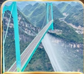
สะพานฮวาเกียง