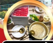
บุฟเฟ่ต์ชาบู เมียร์โมอัน!!