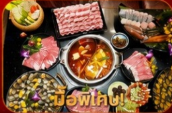
มือพิเค่ง! บุฟเฟ่ต์ชาบูสโตร์ฮ่องกง