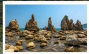
ชายหาดฮาชิคุอิ:

🧳 โหลด 23 KG. x2 ( รวม 46 KG. ) ทั้งไป - กลับ