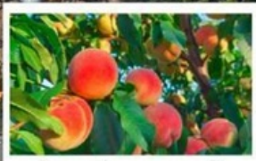
เก็บลูกพีชสด ๆ จากต้น