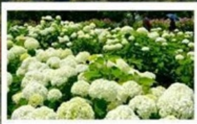
ชมดอกไม้ไฮเดรนเยีย