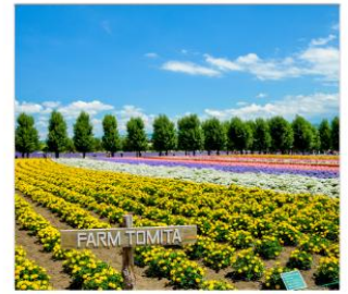
ท่งลาเวนเดอร์โทมิตะ