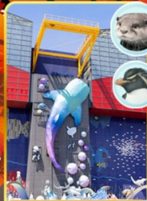
พิพิธภัณฑ์โคยูกิจ

ออนเซ็น 2 คั้น นน.กระเป๋า 23 กก.X2 8Days 5Night