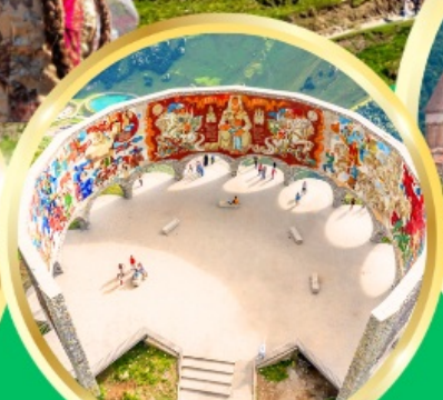
Russian-Georgian Friendship Monument