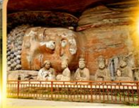
พระแกะสลักหินต้าจู๋