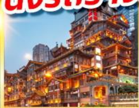
หงหย้าต้ง

บินตรงเชียงใหม่ลงชิง นั่งรถรางชมวิวอุทยานนางฟ้า