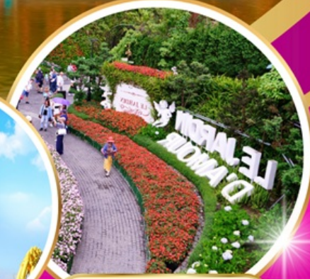
Le Jardin d'Amour

EMIRATES (EK) นำหนักกระเป๋า 30 กิโลกรัม พักโรงแรม 4 ดาว อาหารครบ 6 มื้อ แถมหมวกคนละ 1 ใบ