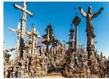
Hill of Crosses