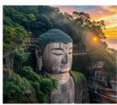
หลวงพ่อดาเล่อซาน