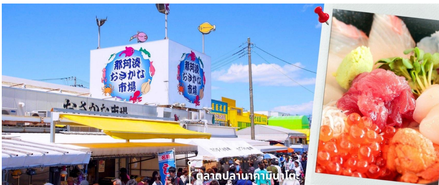
ตลาดปลานาคามินาโตะ

จากนั้นนำท่านเดินทางสู่ ตลาดปลานาคามินาโตะ Nakaminato Fish Market เป็นตลาดปลาที่ใหญ่และมีปลาสดๆ มากมายเทียบกันได้ที่ตลาดปลาซึกิจิ ตลาดปลานาคามินาโตะตั้งอยู่ตามแนวริมน้ำในเมืองมินะโตะ-ฮอนโซ