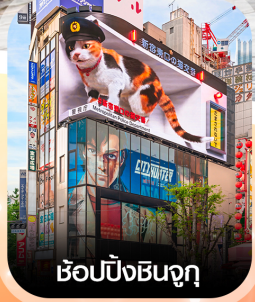
ซ้อปบิงชินจุกุ