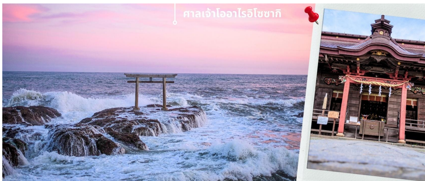
ศาลเจ้าโออาริอิโซซากิ

นำท่านเดินทางสู่ ศาลเจ้าโออาริ อิโซซากิ ตั้งอยู่ที่ เมืองโออาริ (Oarai) จ.อิบารากิ (Ibaraki) มีโลเคชั่นที่คนญี่ปุ่น รู้กันว่าสามารถชมพระอาทิตย์ขึ้นและพระอาทิตย์ตกได้สวยงามที่สุด อีกทั้งบรรยากาศและอารมณ์ก็จะแตกต่างกันไปตามสภาพอากาศและฤดูกาล จุดที่นิยมถ่ายรูปหรือจุดไฮไลท์ที่สุดคือ จุดที่มองเห็นซุ้มประตูโทริอิ (Torii) ตั้งอยู่บนโขดหินริมทะเลออก ซึ่งแยกออกมาจากในเขตด้านใน ของศาลเจ้าโออาริอิโซซากิ นอกจากนี้จะเป็นจุดชมพระอาทิตย์แล้ว ศาลเจ้าแห่งนี้ ยังมีประวัติที่ยาวนาน โดยสร้างขึ้นเมื่อปี ค.ศ. 856 และเป็นທີ່ประดิษฐานของเทพเจ้าโอนามุจิโนะมิโกโตะ (Onamuchi no Mikoto) และเทพเจ้าสุคุนาฮิโคนะโนะมิโกโตะ (Sukunahikona no Mikoto) เชื่อกันว่าเทพเจ้าทั้งสองเป็นผู้นำความอุดมสมบูรณ์และความมั่งคั่งมาให้ประเทศญี่ปุ่น ผู้คนมักจะขอพรให้สุขภาพแข็งแรงและหายจากโรคร้าย ขอให้มีความสุขในการดำเนินชีวิต สมหวังในเรื่องการแต่งงาน มีคุณธรรมและปัญญา อีกด้วย