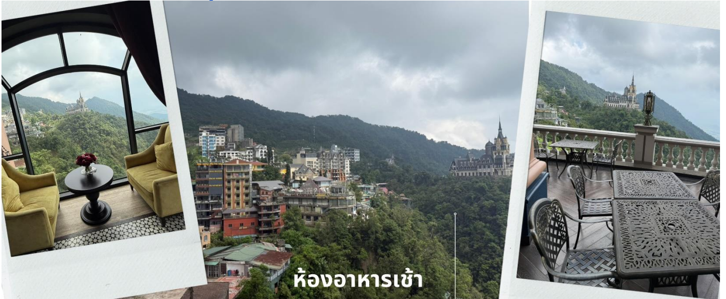
ห้องอาหารเช้า

เช้า รับประทานอาหารเช้า ณ ห้องอาหารของโรงแรม (4) ให้ท่านได้อิสระถ่ายรูปกับปราสาทตามด้าว ณ ห้องอาหารเช้าโรงแรมที่เราพัก