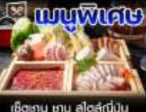
เช็ทซาซู ซาซู สไตล์ญี่ปุ่น