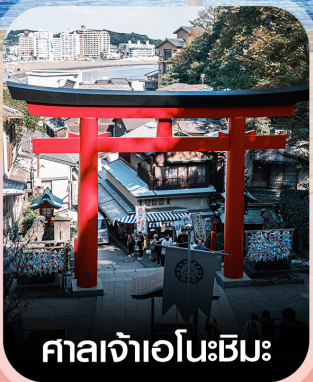
ศาลเจ้าเอโนะชิมะ