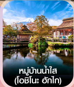
หมู่บ้านน้ำใส (โอะชิโนะ อักโก)

✈️ คอนเฟิร์ม ออกเดินทาง ทุกพีเรียด 2 ท่านขึ้นไป