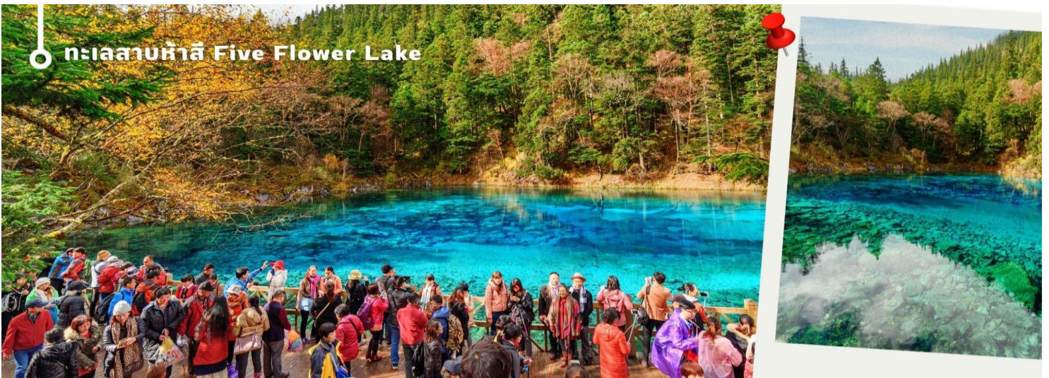
ทะเลสาบห้าสี Five Flower Lake

ทะเลสาบที่ใหญ่ที่สุด สูงที่สุด และลึกที่สุดในจิวจ้ายโกว ด้วยเนื้อที่กว่า 581 ไร่ ความยาวกว่า 7 กิโลเมตร และลึกถึง 103 เมตร ทอดตัวโค้งเป็นรูปพระจันทร์เสี้ยว เนื่องจากหิมะบนภูเขาละลายลงมา น้ำในทะเลสาบสีฟ้าสวยงาม ล้อมรอบด้วยยอดเขาสูงชัน และต้นไม้ใหญ่ที่ปกคลุมด้วยหิมะ งดงามราวหลุดออกมาจากภาพวาด ความพิเศษในช่วงฤดูหนาว ทะเลสาบจะกลายเป็นน้ำแข็งหนากว่า 60 ซม. ทำให้นักท่องเที่ยวนิยมมาเล่นสเก็ตน้ำแข็งกันเป็นจำนวนมาก