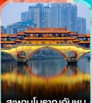
สะพานโบราณอันชุน