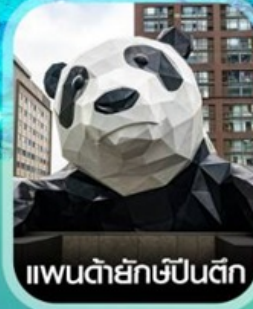
แพนด้ายักษ์ป็นตีก