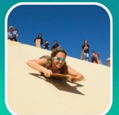
เล่นกระดานทรายจากยอดเนินทรายสูงชัน