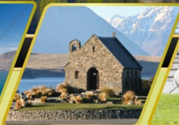
ทะเลสาบเทคาโป