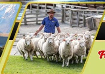
วอลเตอร์พีดฟาร์ม