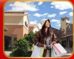
อิสระช้อปปิ้ง BEIJING OUTLET