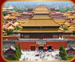
เขื่อนมรดกโลก พระราชวังกุ่กิง