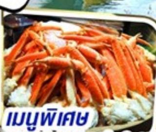
เมนูพิเศษ บุฟเฟ่ต์ชาบู 1 ชนิด