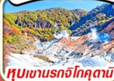
หุบเขานรกโจคุตานิ

รวม ค่าภาษีที่ปรับขึ้นแล้ว (ประกาศ 1 เม.ย. 69)