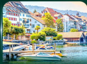
เมืองสวยริมทะเลสาบ ชุก