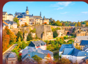
ย่านเมืองเก่า ลักเซมเบิร์ก