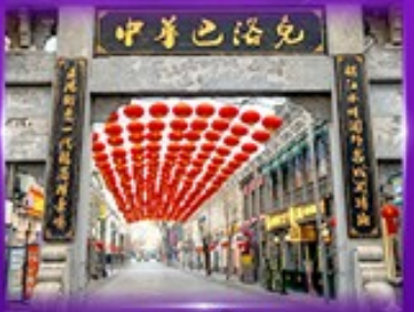
ถนนบาร์จอก