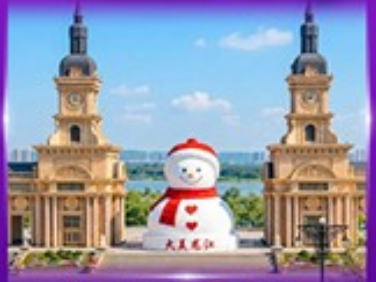
ตึกตาสหิมะยักษ์ ฮาร์บิน