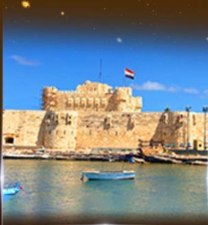
ป้อมปราการ Quite Bay