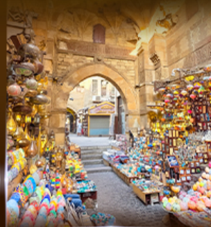
ตลาดห่านเอลคาลีลี