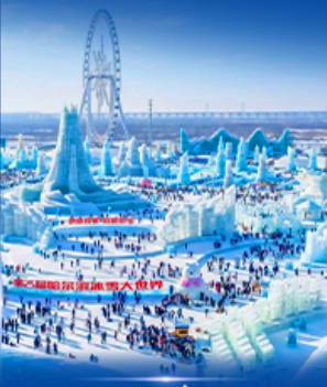
เทศกาลหิมะและน้ำแข็ง 2027