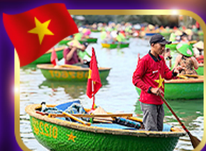
เรือกระด้ง หมู่บ้านกัมทาน