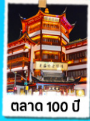
ตลาด 100 ปี