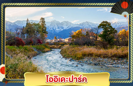
โออิเคะปาร์ค