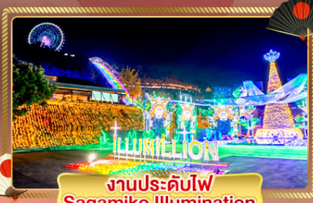
งานประดับไฟ Sagamiko Illumination