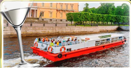
ส่องเรือแม่น้ำแคว พร้อมเสิร์ฟ Vodka Tasting

📅 เดินทาง : 14-21 มิ.ย.69 / 28 มิ.ย.-05 ก.ค.69 / 24-31 ก.ค.69