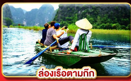
ล่องเรือตามกัก