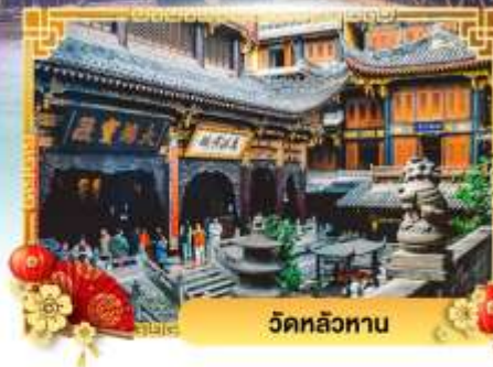
วัดหลัวหลาน