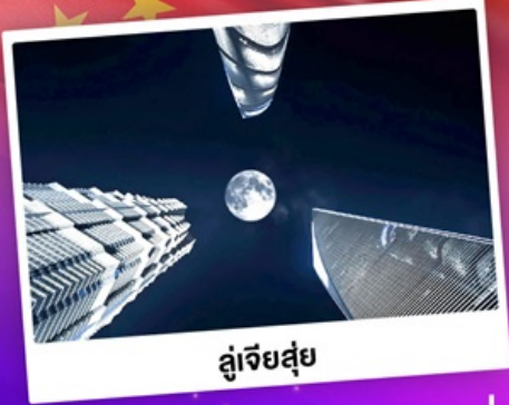
ดูเจียสู่ย

ใช้แผนเดินทาง "เซี่ยงไฮ้" เที่ยวดิสनीแลนด์ดูพลุสุดอลัง