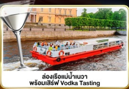
ส่องเรือแม่น้ำเนวา พร้อมเสิร์ฟ Vodka Tasting