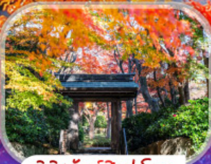
พิพิธภัณฑ์ศิลปะโมเอ