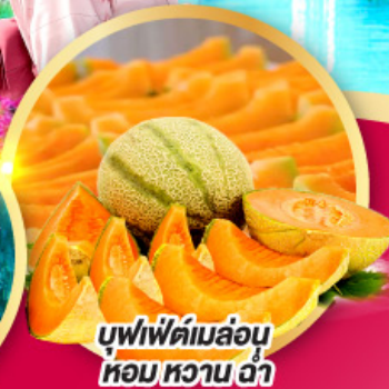
บุฟเฟ่ต์เมล่อน หอมหวาน ฉ่ำ