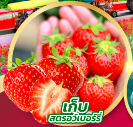
เก็บ สตอร์วเบอร์รี่