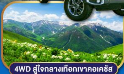
4WD สู่ใจกลางเทือกเขาคอเคซัส