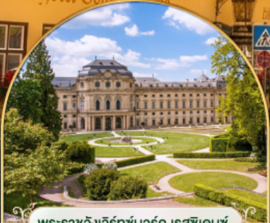
พระราชวังแวร์ซายส์ นคร ปารีส ฝรั่งเศส