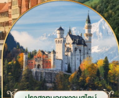
ปราสาทนอยชวานสไตน์ เยอรมนี