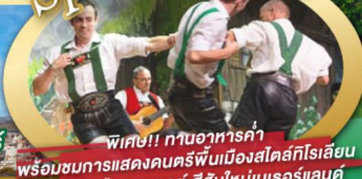
พิเศษ!! ทานอาหารค่ำ พร้อมชมการแสดงดนตรีพื้นเมืองสไตส์ทีโรเลียน และเยือนเมืองอูเทรคต์ สีสันใหม่เนเธอร์แลนด์

ไฮไลท์ในโปรแกรม • เยือนเมืองแห่งแคว้นบาวาเรีย และ ทีโรล • สุกสนานเหมืองเกลือเบิร์ชเทสกาเดิน • เข้าชมปราสาทนอยชวานสไตน์ • เดินเล่นจัตุรัสโรเมอร์ ซ็อบป์ิง Zeil Street • ถ่ายรูปมุมสวยของหมู่บ้านอัลสติก • ซิลลา ไปในเมืองซาลสบูร์ก บ้านเกิดโมสาร์ท • ล่องเรือหมู่บ้านทีธูร์น และ ล่องเรือชมนครอัมสเตอร์ดัม • ซ็อบป์ิงจุ้ย่านดิมสแควร์และเดินเล่นย่านโคมแดง