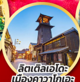
ลิตเติลเอโดะ เมืองคาวาโกเอะ