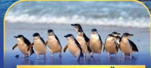
พาหรรณกเพนกวิน