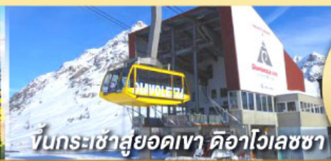
ขึ้นกระเช้าสู่ออดเขา ดือาไวเลชซา