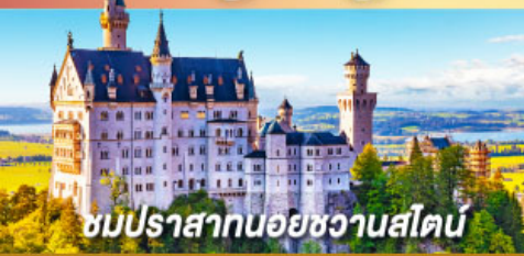
ชมปราสาทนอยชวานสไตน์