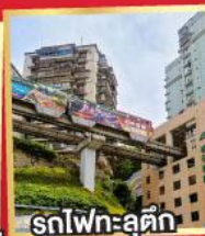
รถไฟฟ้า-ลูตึก