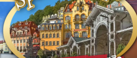
ชมสถาปัตยกรรมคลาสสิก เมือง คาร์โลวี วารี