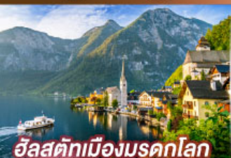
อิลสติกเมืองมรดกโลก