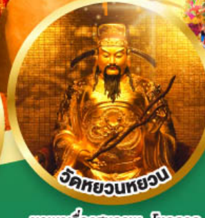
วัดหยวนทวยวน

ขอพรเรื่องสุขภาพ, โชคลาภ ความเจริญก้าวหน้า