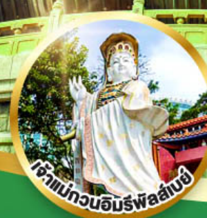
เจ้าแม่กวนอิมทรัพย์สิน