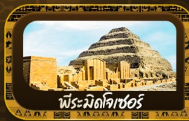
พีระมิดโจเซอร์